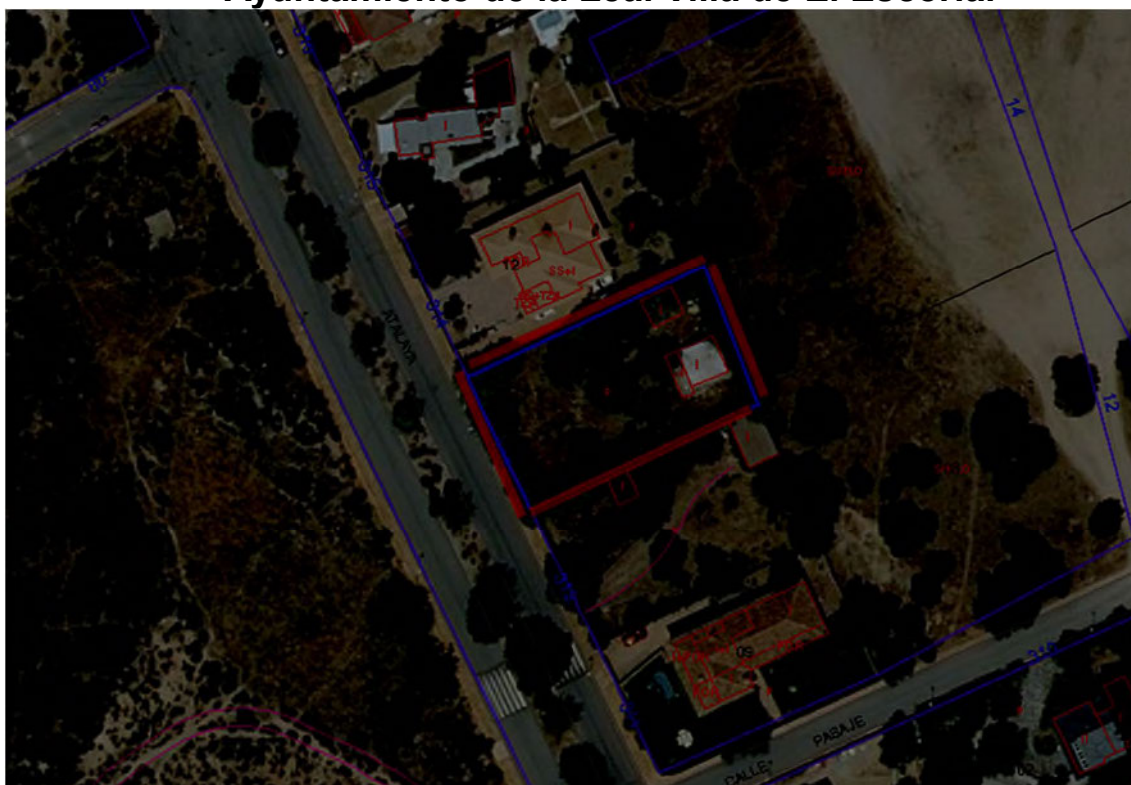
Ubicación señalada del ejemplar en el interior de la parcela objeto de estudio