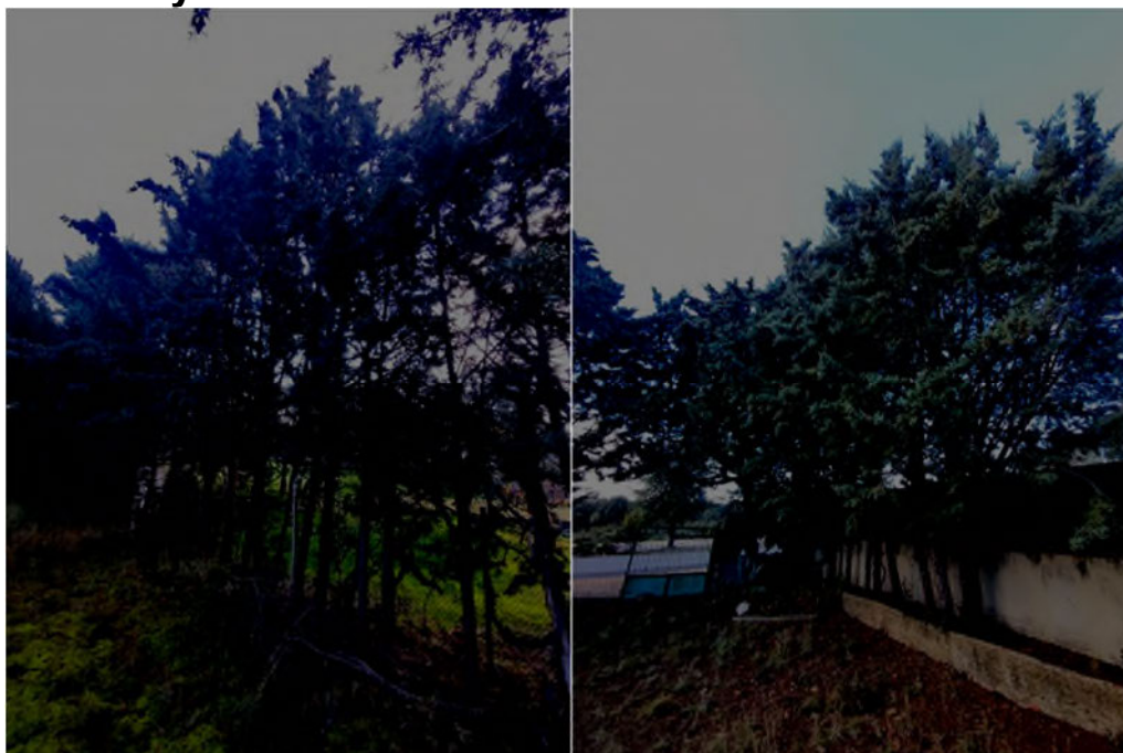
Estado actual de los ejemplares objeto de estudio