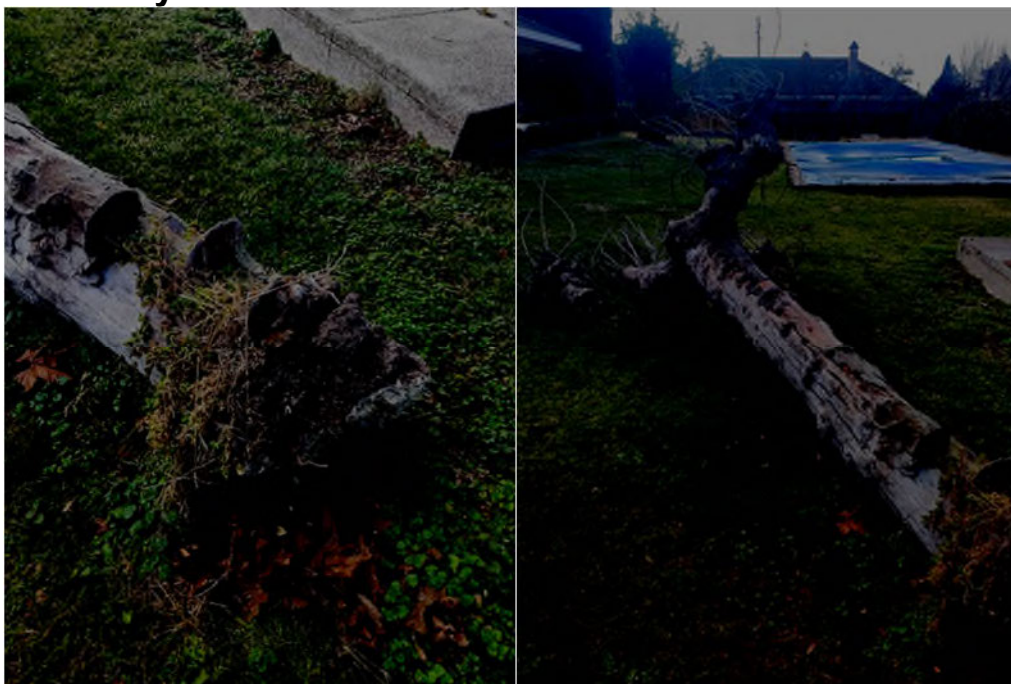
Fotos del ejemplar objeto de estudio

CUARTO. - La ordenanza regula dos procedimientos para la tramitación de las solicitudes: el ordinario y el de urgencia, en los artículos 24 y 25, respectivamente. No obstante, para los ejemplares en situación de decadencia o muerte por razones naturales se establece un procedimiento específico en los artículos 9 y 12.2 OPFA por el que se impone al propietario la obligación de comunicar tal circunstancia al Ayuntamiento y a los servicios técnicos de la Concejalía responsable de Medio Ambiente, la verificación de dicho estado, elaborando la ficha del árbol, certificando la muerte o decrepitud natural del ejemplar y autorizando, en su caso, la corta.